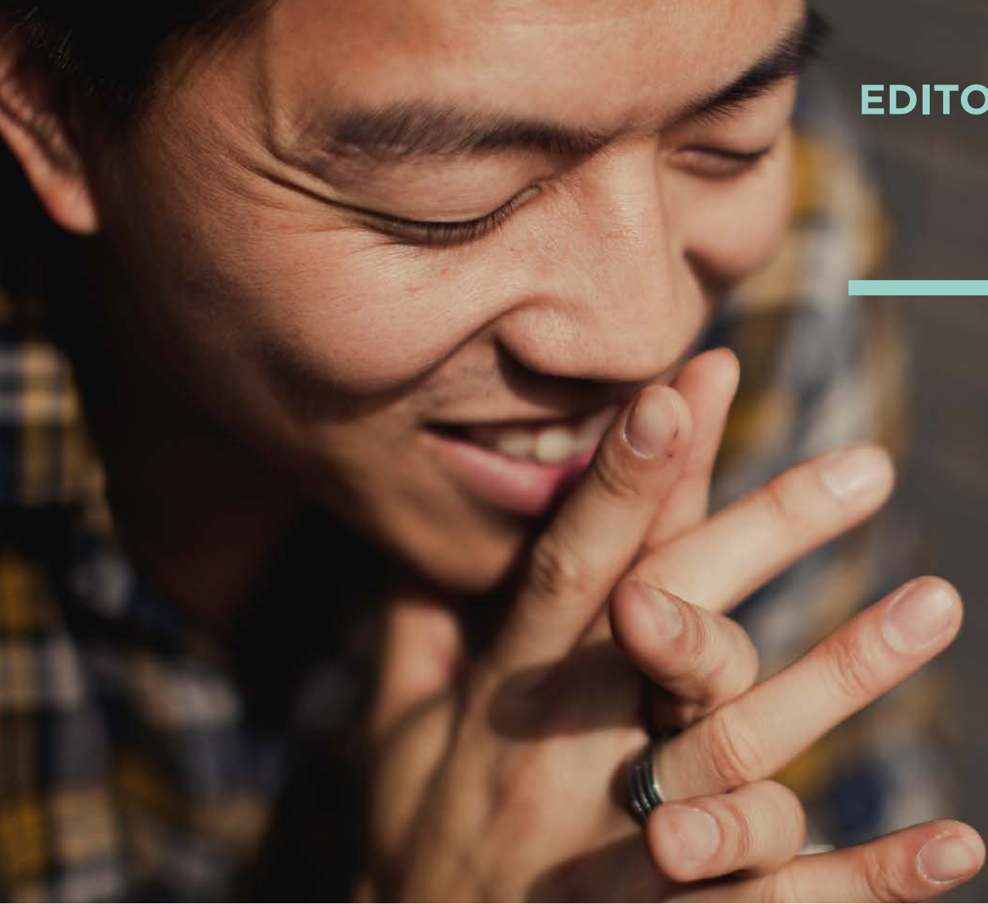
tableau était accroché sur le mur : Peu de prière, peu de puissance. Beaucoup de prière, beaucoup de puissance. Pas de prière, pas de puissance.

les changements de société dans laquelle les jeunes évoluent... (la liste peut être longue). Priez avec nous pour ces sujets !